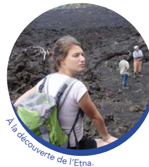
À la découverte de l'Etna.