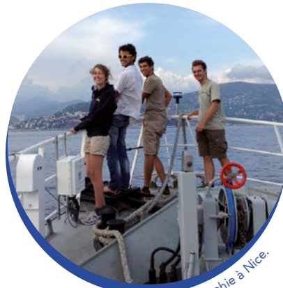
Stage d'océanographie à Nice.