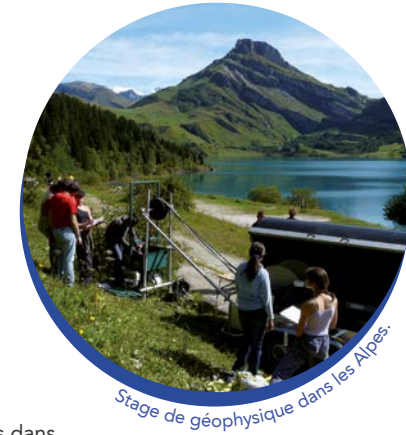
Stage de géophysique dans les Alpes.

Il consiste en un stage de recherche dans l'un des laboratoires associés aux masters STEP ou SDUEE, dont ceux du département de géosciences de l'ENS. Ce stage est un point de départ pour un doctorat ou une spécialisation pour un projet professionnel.